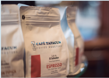
Café Tapacun, Café de Casal

El Banco Hipotecario es un aliado clave para el eco.business Fund desde 2015. Es una de las pocas instituciones que se especializa en el sector agrícola en El Salvador y tiene la experticia en la provisión de créditos a empresas en la cadena de valor del café. El banco, con su equipo de agrónomos dedicados, monitorea y evalúa las prácticas y desempeño general de cada cliente. Casal ha sido cliente del Banco Hipotecario desde la apertura del beneficio en 1997. Desde entonces, en parte, gracias al eco.business Fund, Casal ha recibido múltiples préstamos para la modernización del beneficio Piedra Grande y la renovación de sus plantaciones.