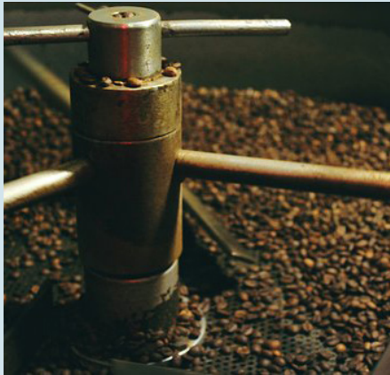
Tostado de café

Fundado en Nicaragua en diciembre de 1991, el Banco Lafise Bancentro es una institución bancaria pionera que tiene como objetivo ofrecer soluciones financieras confiables, seguras, convenientes y flexibles a sus clientes. El Banco Lafise Bancentro tiene aproximadamente 15.000 clientes y entre estos se encuentra Finca La Luz quien ha sido su cliente desde el año 2001. Finca La Luz ha recibido un préstamo del banco por 1 millón de dólares con financiación del eco.business Fund para renovar los cultivos.